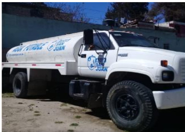
PIPAS DE AGUA