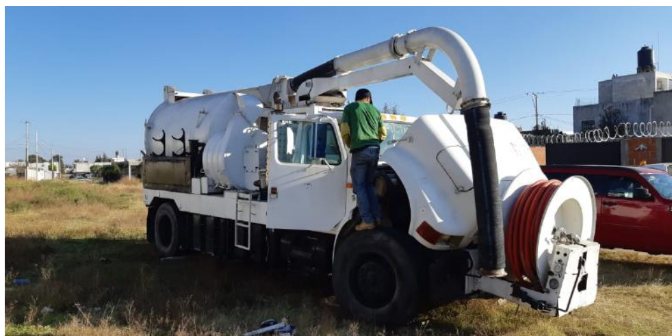
EQUIPO VACTOR INTERNATIONAL DE 10 YD3.