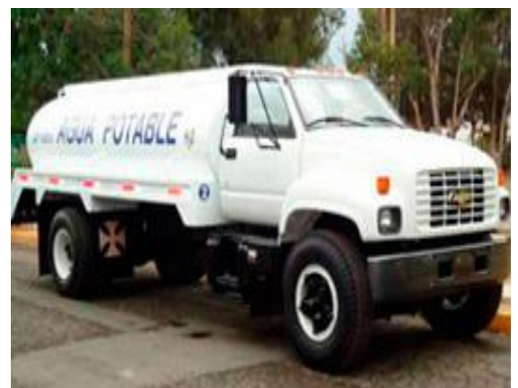
PIPAS DE AGUA